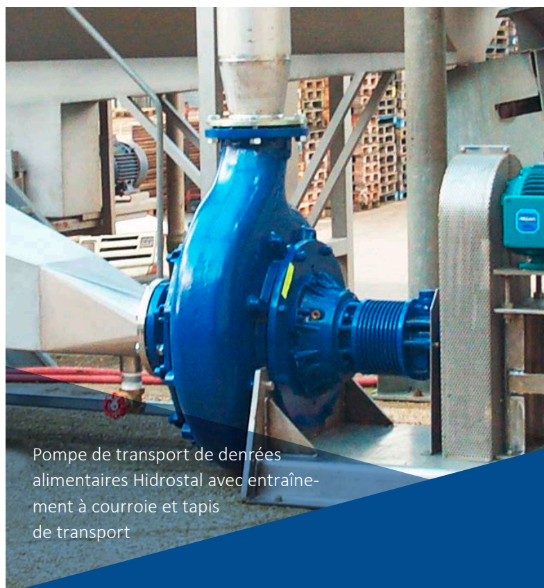
Pompe de transport de denrées alimentaires Hidrostral avec entraînement à courroie et tapis de transport

La pompe Hidrostral de type F garantit un processus de transformation en douceur, fiable et continu pour vos denrées alimentaires. Son système fermé est également un atout en termes de santé et de sécurité.