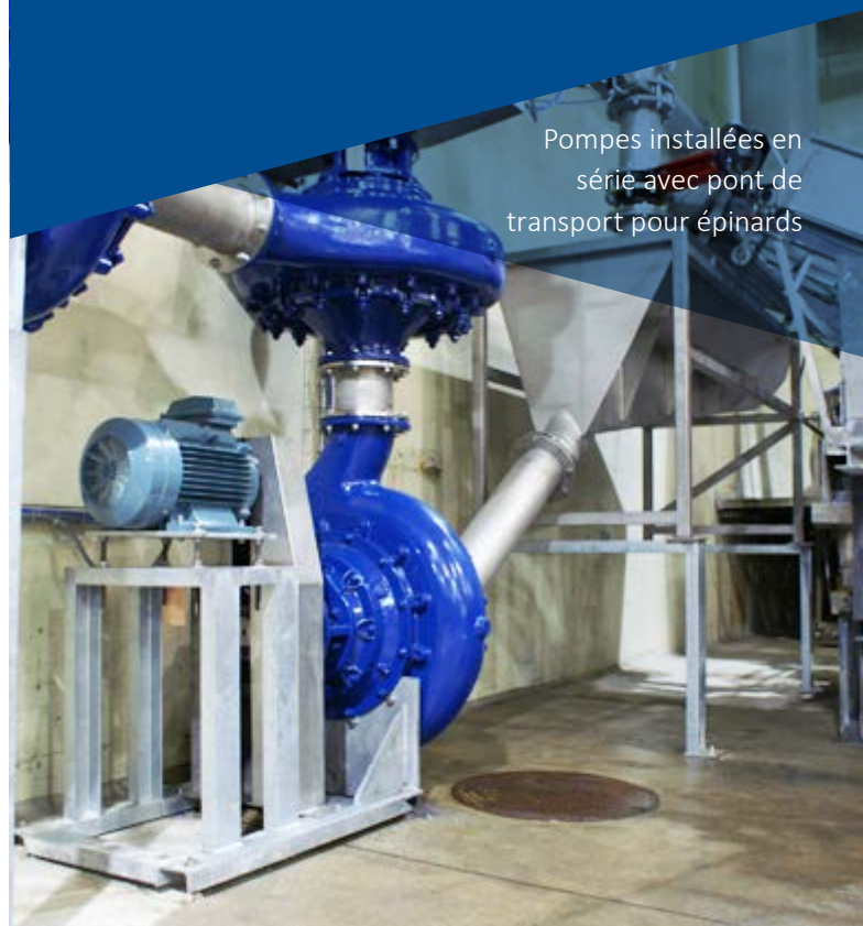
Pompes installées en série avec pont de transport pour épinards

La pompe Hidrostral de type F garantit un processus de transformation en douceur, fiable et continu pour vos denrées alimentaires. Son système fermé est également un atout en termes de santé et de sécurité.